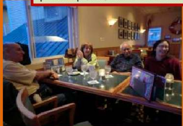
המארחים שלנו... על כוס קפה ראשון