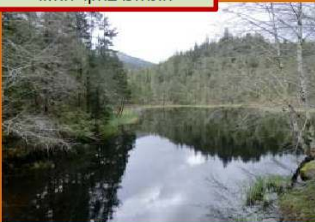
התחלנו בחקר האזור