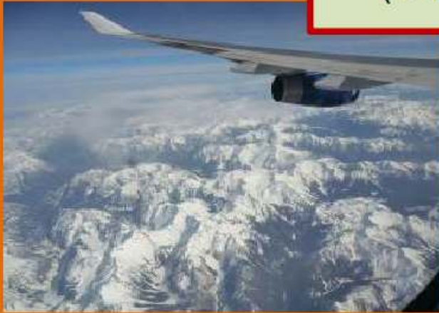
אנחנו בחצי הדרך לאלסקה