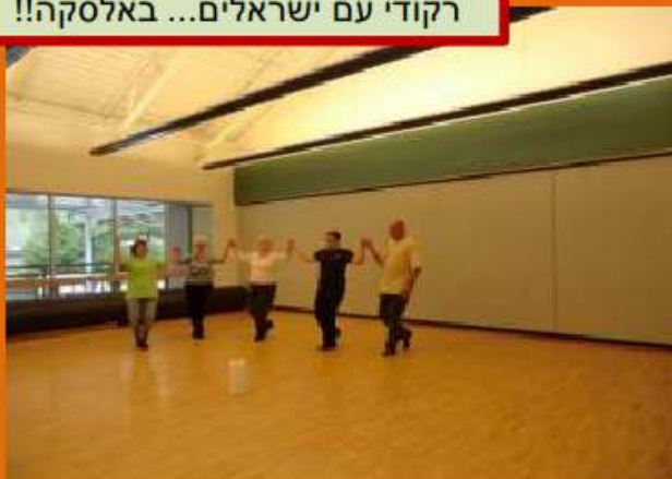
רקודי עם ישראלים... באלסקה!!