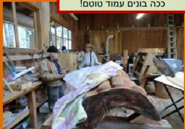
ככה בונים עמוד טוטם!