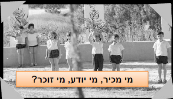
מי מכיר, מי יודע, מי זוכר?