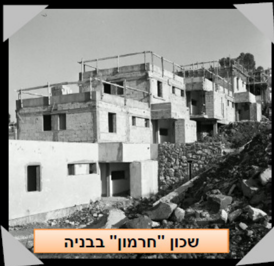
שכון "חרמון" בבניה