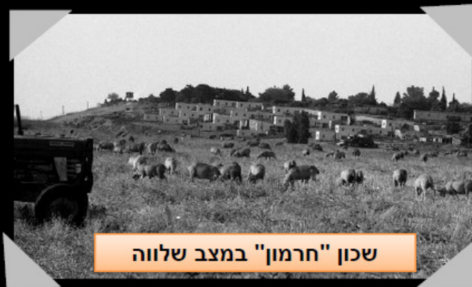
שכון "חרמון" במצב שלווה