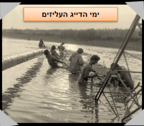
ימי הדייג העליזים