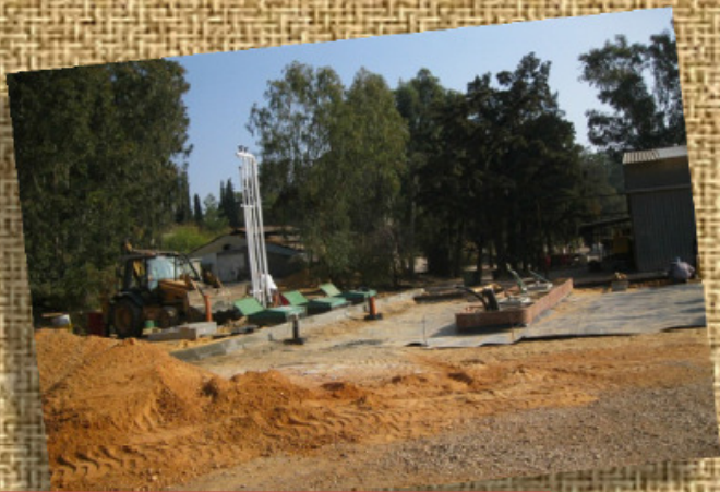
תחנת הדלק מתקדמת יפה