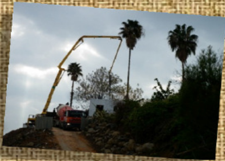
בניה חדשה בכל מיני פינות