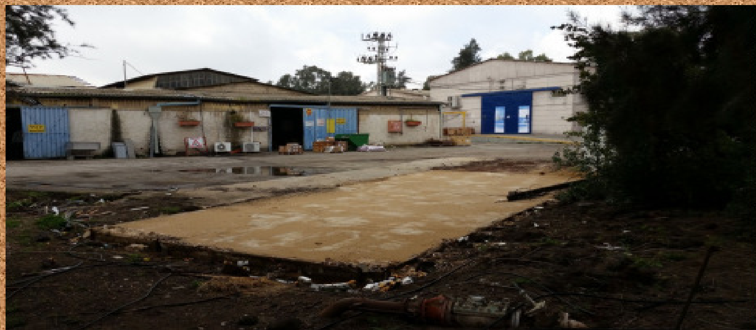
משרדי מחלקת החמרון - ז"ל (על רקע מחלקת החמרון)