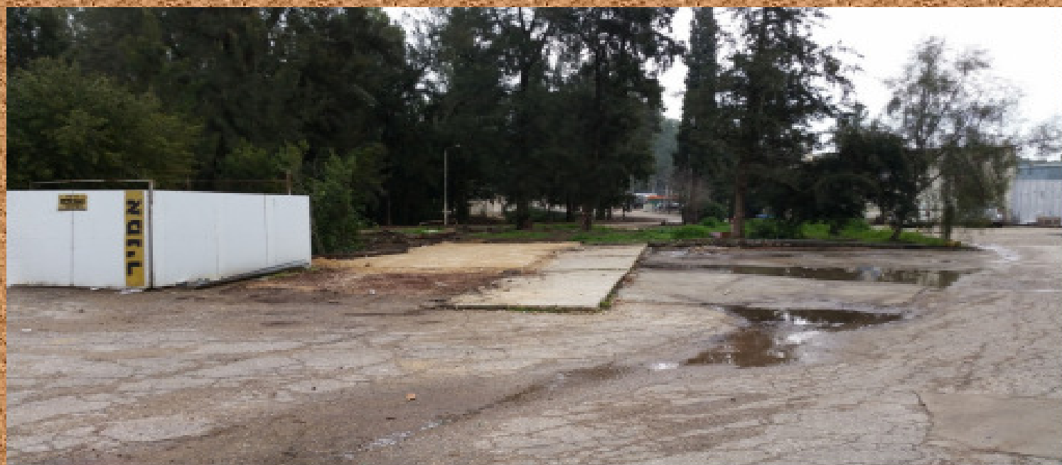
משרדי מחלקת החמרון - ז"ל (מבט לכוון המוסכים)

מפעל הבונים הידוע עוד מראשית הקיבוץ עבר מפנה ניהולי. כעת הוא עובר "מתיחת פנים" רצינית כאשר חלקים רבים ממנו נעלמים אט אט מהשטח.