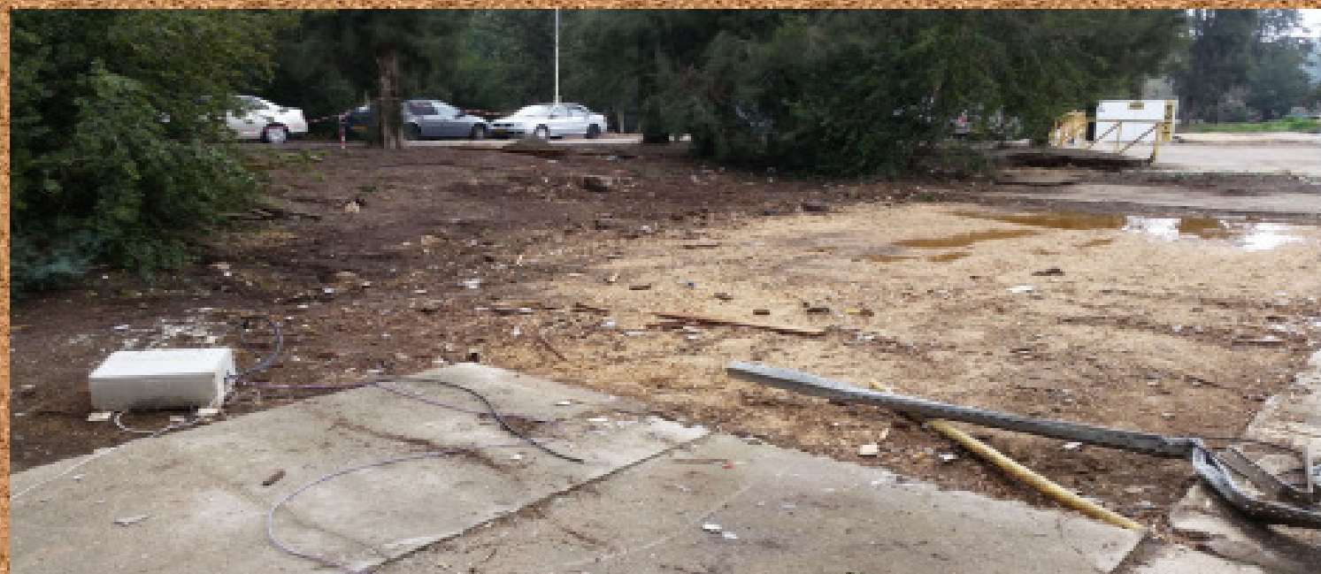
משרדי מחלקת עיבוד שבבי - ז"ל (מבט לכוון המוסכים)