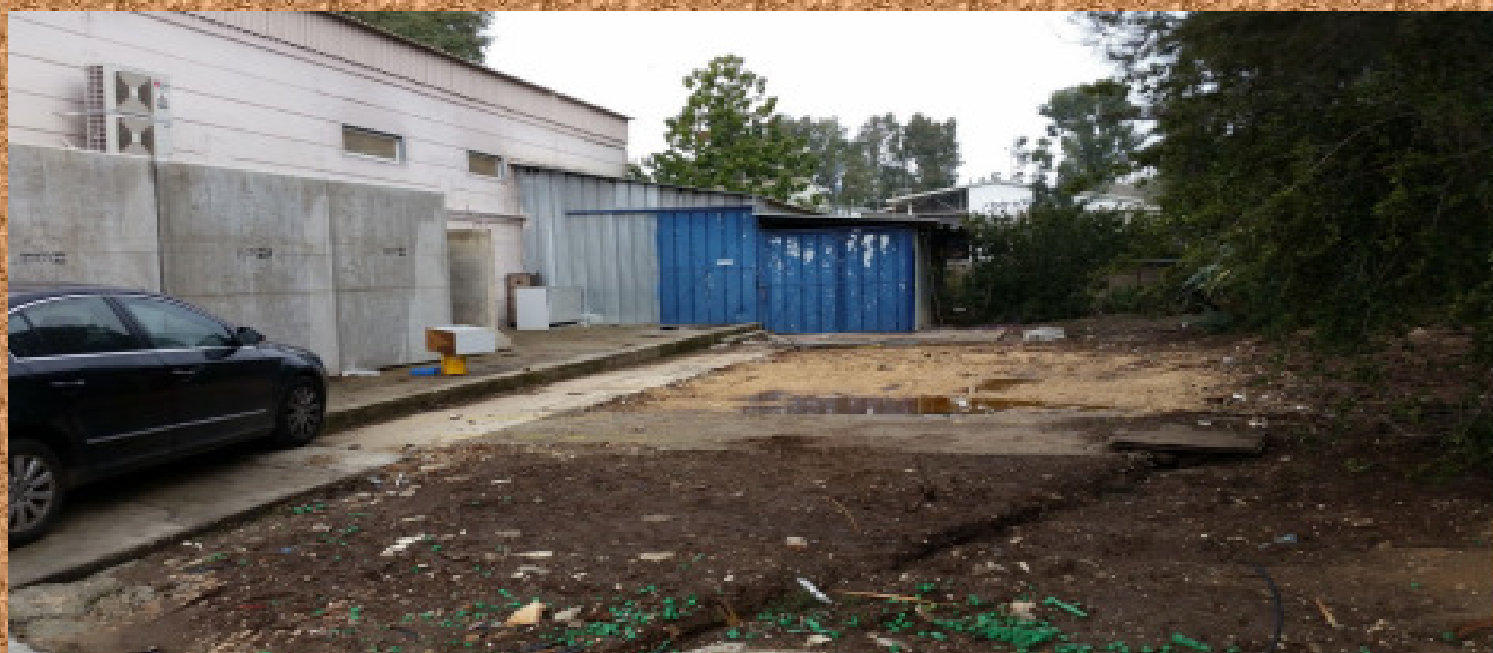
משרדי מחלקת עיבוד שבבי - ז"ל (משמאל מח. עיבוד שבבי)