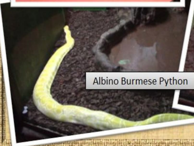
Albino Burmese Python