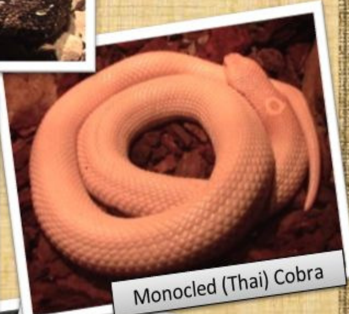
Monocled (Thai) Cobra