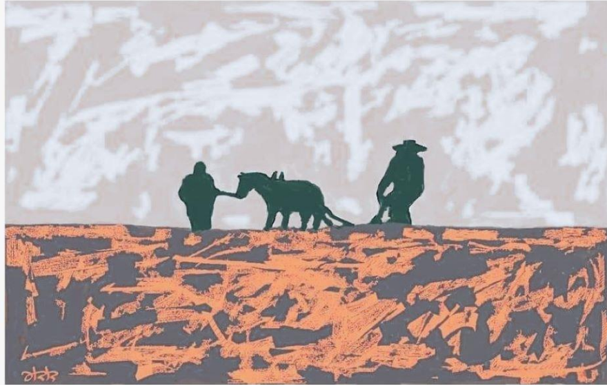
בדידותו של החורש למרחקים ארוכים

אֲשֶׁרֵי הַיּוֹדְעִים אֲשֶׁר יִקְרָא לָבָם מִמְדָּבָר וְעַל שִׁפְתֵיכֶם תִּפְרַח הַדְּוִמְיָה. אֲשֶׁרֵיהֶם כִּי יֶאֱסְפוּ אֶל תוֹךְ לֵב הָעוֹלָם לוֹטִי אֲדַרְתַּ הַשִּׁכְחָה וְהִיָּה חֶקֶם הַתְּמִיד בְּלִי אִמְרָה.