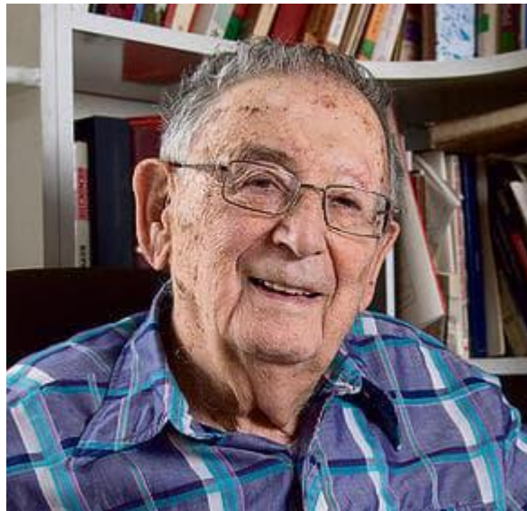
פרופסור יהודה באואר

יהודה באואר, עמוד האור שהלך לפני המחנה הנאור והליברלי בחברה הישראלית הלך לעולמו השבוע ונמצאנו חסרים מאוד. מאוד.