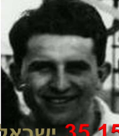
Kfar-Hanassi - Israel