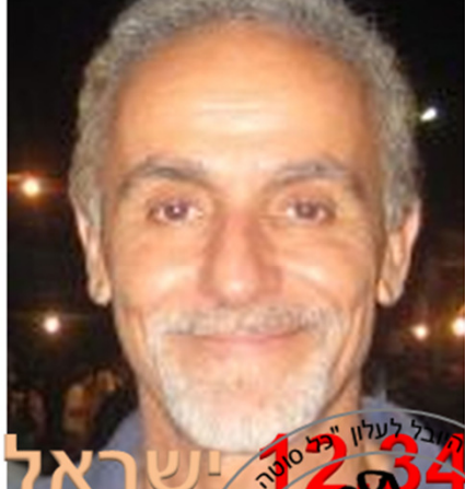
Kfar-Hanassi - Israel