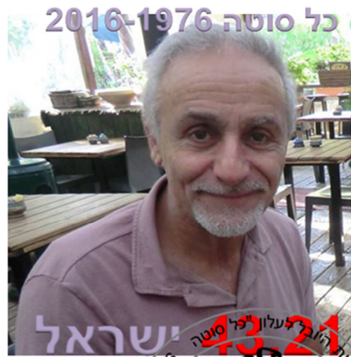
Kfar-Hanassi - Israel

כאן, בחיור נבון משה בהזכרו יזרנו בן משק שייסד את העלון