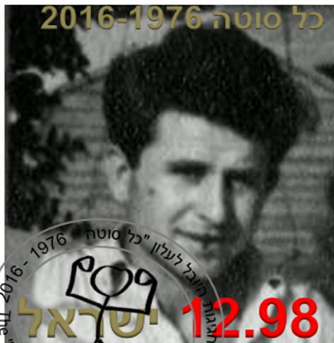
Kfar-Hanassi - Israel

השרות הבולאי התכוונו להוציא סדרת בולים ליום מיוחד זה אך עקב אי הבנה מוחלטת של מהות העלון, לא השכילו אפילו לחשוב על הרעיון ובכך לא הוצע דבר לתקופה ארוכה. היום מציג "כל סוטה" את סדרת הבולים החדשה שתקרא בישראל סדרת "בול בול 2016"