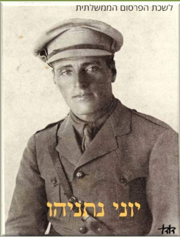
לשכת הפרסום הממשלתית