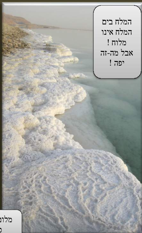
המלח בים המלח אינו מלוח! אבל מה-זה יפה!