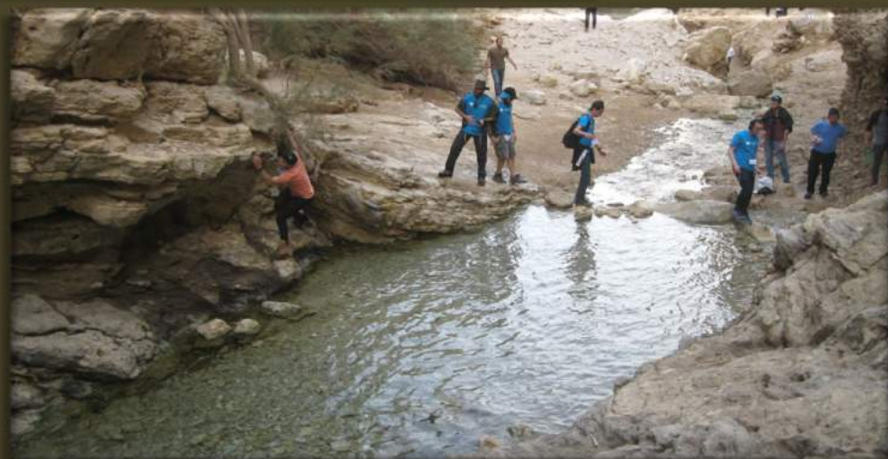
הליכה בנחל בוקק, מעלה בוקק ומצודת בוקק