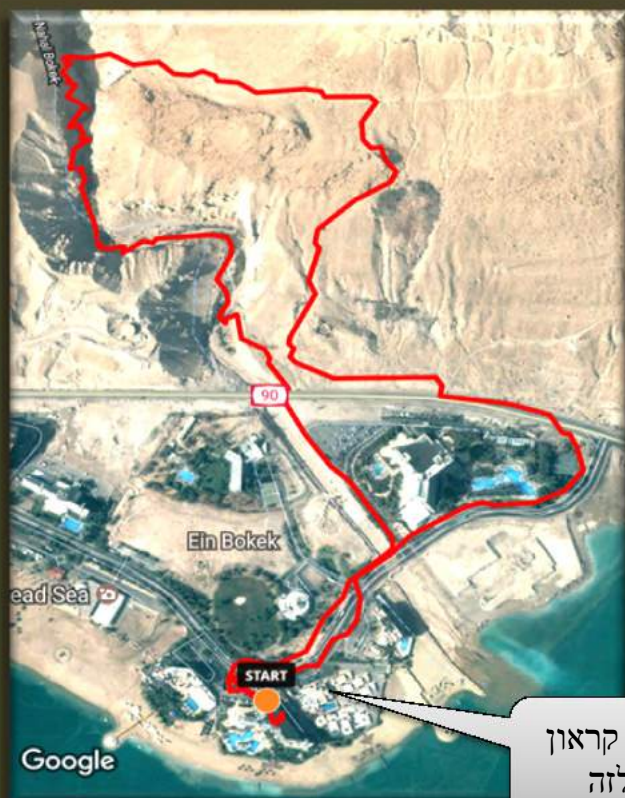
מלום קראון פלזה